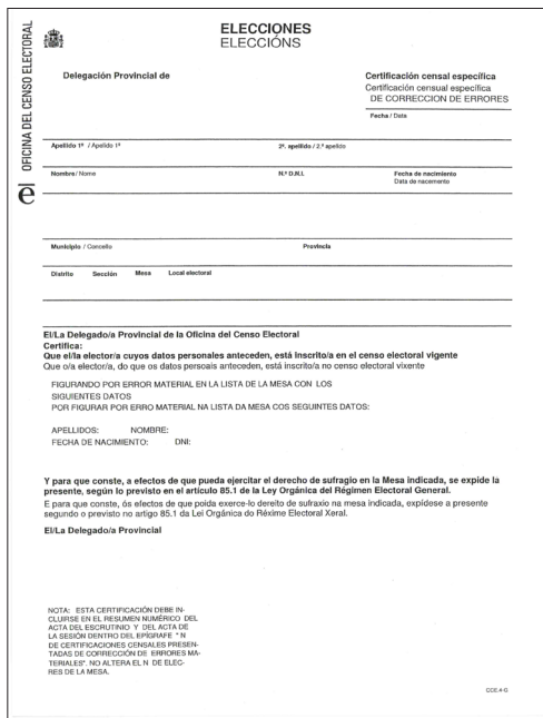
MODELO DE CERTIFICACIÓN CORRECCIÓN DE ERROS

As certificacións censuais específicas NON DEBEN CONFUNDIRSE: