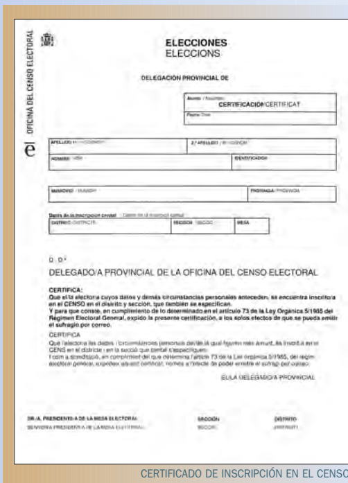
CERTIFICADO DE INSCRIPCIÓN EN EL CENSO