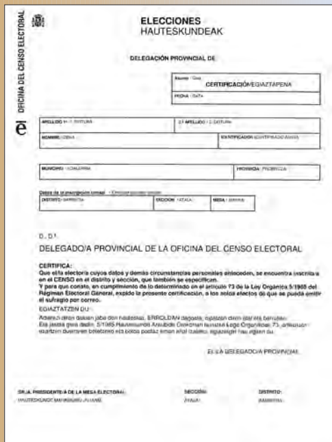
ERROLDAREN INSKRIPZIO-ZIURTAGIAREN EREDUA

- Mahaian kreditaturiko artekariak, baldin eta mahai horri dagokion barruti berean inskribatuta badaude eta euren mahaian botoa posta bidez emateko eskubidea erabili ez badute.