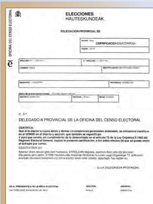
CERTIFICADO DE INSCRIPCIÓN EN EL CENSO