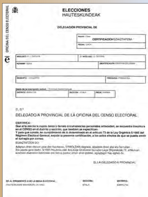
ERROLDAREN INSKRIPZIO-ZIURTAGIAREN EREDUA